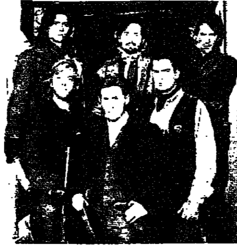
تجوم منطلق فنية